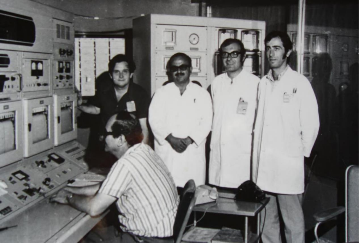
Çekmece Nükleer Araştırma Merkezinde çalışırken

Evin ölen sahibinin bodrumda saklı şarapları olduğunu öğrenmişler, Varisler şarapların varlığından haberdar oluncaya kadar epey şarap eksilmiş. Zaten varisler bu şarapların tümünü kiracılara hediye etmişler. Bizimkiler de utanıp, daha önce aşırıdıkları şaraplardan söz edememişler.