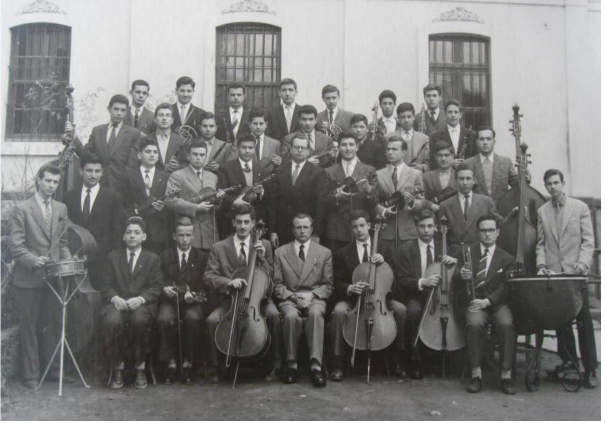
Saint Joseph Lisesi Klasik Müzik Orkestrası