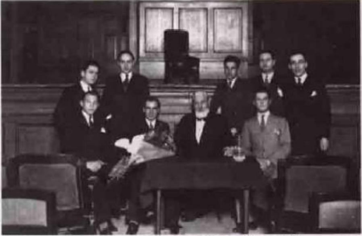
Türk dostu, ünlü Fransız yazar Claude Farrer'in verdiği bir konferansın sonrasında...