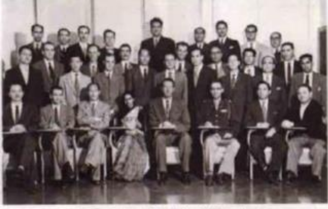
Radyoizotoplar üzerine çalıştığı Onk Ridge Nükleer Araştırma Enstitüsü'nde, farklı ülkelerden çok sayıda araştırmacı da bulunuyordu.