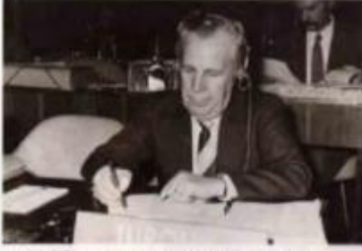
1960'da ITÜ'de düzenlenen Uluslararası Kimya Sınavı Kongresi (sağda), UNESCO Genel Konferansı, Paris 1972 (sola).